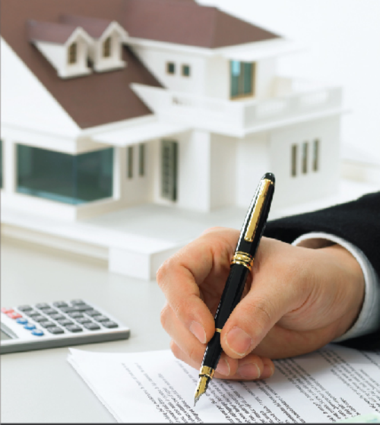
FINANAC/REAL ESTATE 금융/부동산