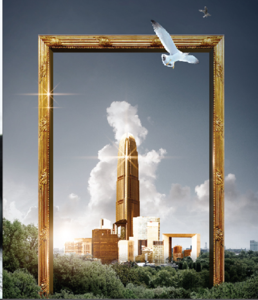
OFFICE JOB 사무직종